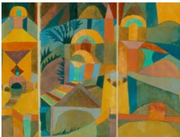
Paul Klee, Temple Gardens

Una goccia di rugiada, adamantina, cade sui sassi