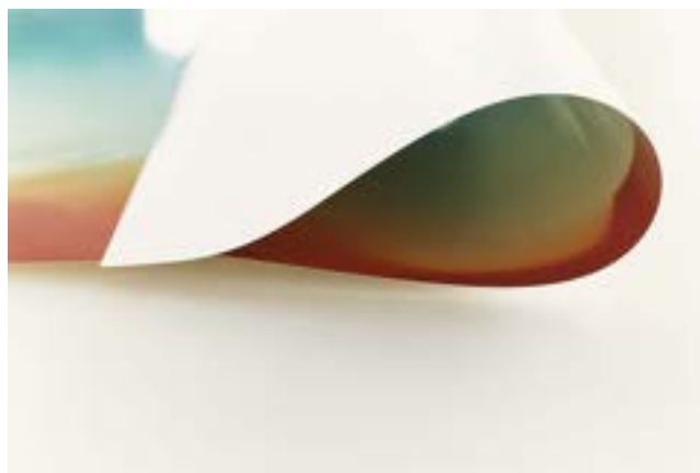
Wolfgang Tillmans, Paper drop , 2006

Martedì 18 giugno, ore 18, in sede: "Un libro per l'estate" , incontro di chiusura delle attività sociali, con proposte di letture estive da parte dei Soci e per chi lo desidera scambio di libri. Con rinfresco! Evento gratuito , aperto a Soci e amici.