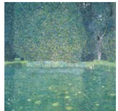
Gustav Klimt, Park at Kammer Castle , 1909